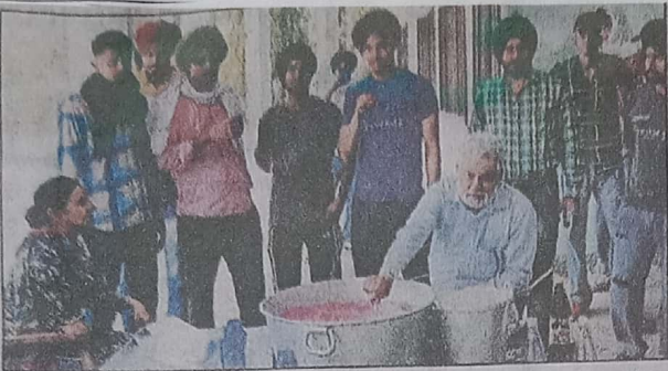
ਗੁਰੂ ਗੋਬਿੰਦ ਸਿੰਘ ਕਾਲਜ ਸੰਘੇੜਾ ਵਿਖੇ ਐਨ.ਐਸ.ਐਸ. ਕੈਂਪ ਦੌਰਾਨ ਠੰਢੇ ਮਿੱਠੇ ਜਲ ਦੀ ਛਬੀਲ ਲਾਉਣ ਮੌਕੇ ਕਾਲਜ ਸਟਾਫ਼ ਤੇ ਵਲੰਟੀਅਰ।