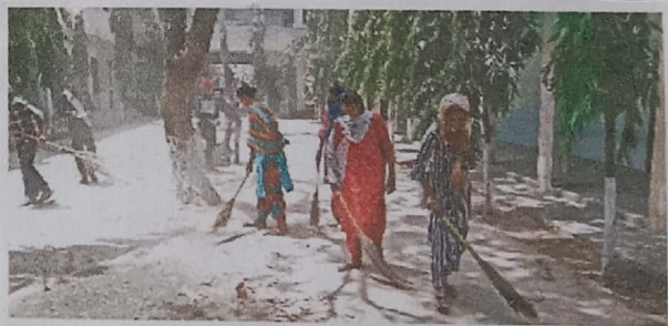
ਕੈਂਪ ਦੌਰਾਨ ਸਫ਼ਾਈ ਕਰਦੇ ਹੋਏ ਵਲੰਟੀਅਰ।